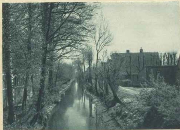
ENTWÄSSERUNGSGRABEN IN KOLLMAR

In den damaligen unruhigen Zeiten des dreizehnten und vierzehnten Jahrhunderts, als namentlich das Raubrittertum sich in den Marschen unliebsam bemerkbar machte, erkannten auch die Bauern den Wert einer guten Landesverteidigung, deshalb stellten die wohlhabenden Bauern ausgerüstete Mannen und traten in den Kriegsdienst ihres Lehnsherrn. Um als Ritter aufgenommen zu werden, genügte es, daß der Besitzer eines größeren Hofes so viel Einkünfte hatte, daß er sich und einige Knechte, mit Schild und Schwert ausgerüstet, in den Dienst des Lehnsherrn stellen konnte. Vielfach haben die wohlhabenden Bauern davon Gebrauch gemacht und manche späteren Rittersgeschlechter sind aus den Bauerngeschlechtern hervorgegangen. Die meisten haben sich allerdings nicht lange behaupten können, sind entweder abgewandert oder ausgestorben, nur zwei reichen in die heutige Zeit hinein, das 1220 begründete Geschlecht derer v. BROCKDORF und VON DER SCHULENBURG. Doch auch