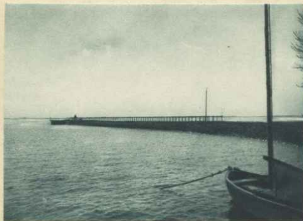
HAFEN UND ANLEGESTELLE IN KOLLMAR

Diese für die hannoversche Elbküste gegebene Schilderung gilt auch für die Sachseninseln am rechten Elbufer. Die künstlichen Wurten, die zunächst nur das einzelne Haus schützten, sind Vorbild geworden für die Eindeichung des ganzen Landes. Noch heute kann man bei einigen Ortsnamen feststellen, daß hier ursprünglich die erste Siedlung auf Wurten errichtet