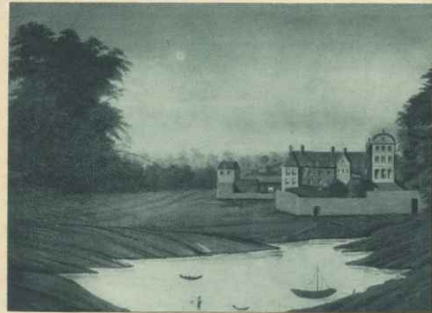
DAS EHEMALIGE SCHLOSS »OEVELGÖNNE« DES GUTES GROSS-KOLLMAR

droht wurde, denn BALTHASAR VON AHLEFELDT, der nach dem Tode seines Bruders Jürgen die Herrschaft übernommen hatte, forderte 1583 neue Abgaben, wodurch abermals eine Empörung unter den Bauern hervorgerufen wurde. Auch hier mußte erst wieder die Vermittlung des Königs angerufen werden, um einen Vergleich mit den Bauern herbeizuführen. Balthasar scheint übrigens ein Draufgänger gewesen zu sein, der sich anscheinend vorgenommen hatte, den Bauern zu zeigen, was eine Harke ist, denn 1586 ließ er sich bei Kollmar das Schloß Oevelgönne bauen und zwang die Bauern, beim Schloßbau und auch bei der späteren Reinigung des Burggrabens zu helfen. An dem Torflügel ließ er warnend den Spruch einmeißeln: »Wär Kollmar und Niendörp nicht up de Krütze gahn, so hatte Oevelgönne hier nicht stahn.«