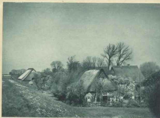
DEICHLANDSCHAFT IN KOLLMAR

Als sie im elften Jahrhundert in die Haseldorfermarsch ihren Einzug hielten, bestand die Gegend aus »Insulenn und Pfützen«, und erst durch die Gesamteindeichung der gesamten Marsch wurden die Inseln landfest, die Flethe und Seen verschlickten und ein großes fruchtbares Marschgebiet entstand im Laufe der Jahrhunderte, das die Ansiedler zu wohlhabenden