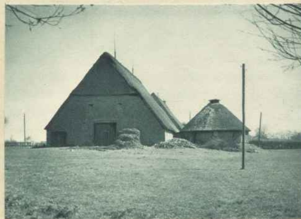
SCHEUNE MIT LIMBAUTEM GÖPELWERK IN KOLLMAR

bei späterer Erbteilung 1716 in Groß- und Klein-Kollmar geteilt wurde. Das Eigentum am Lande besaßen nach wie vor die Bauern, die dem Gutsherrn nur Abgaben und Leistungen schuldeten.