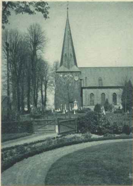
DIE AUS DER MITTE DES 15. JAHRHUNDERTS STAMMENDE KIRCHE IN KOLLMAR