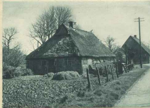
TYPISCHES BAUERNHAUS IN KOLLMAR