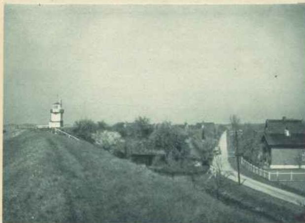
DEICHPARTIE IN KOLLMAR

Die Marschinseln, namentlich in der Gegend von Kollmar, scheinen allerdings infolge ihrer Unzugänglichkeit weniger gelitten zu haben, denn wir wissen aus einer Urkunde aus dem Jahre 1100, daß der