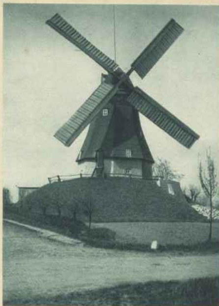
MÜHLE AUF EINER DER TYPISCHEN WÜRTEN IN KOLLMAR