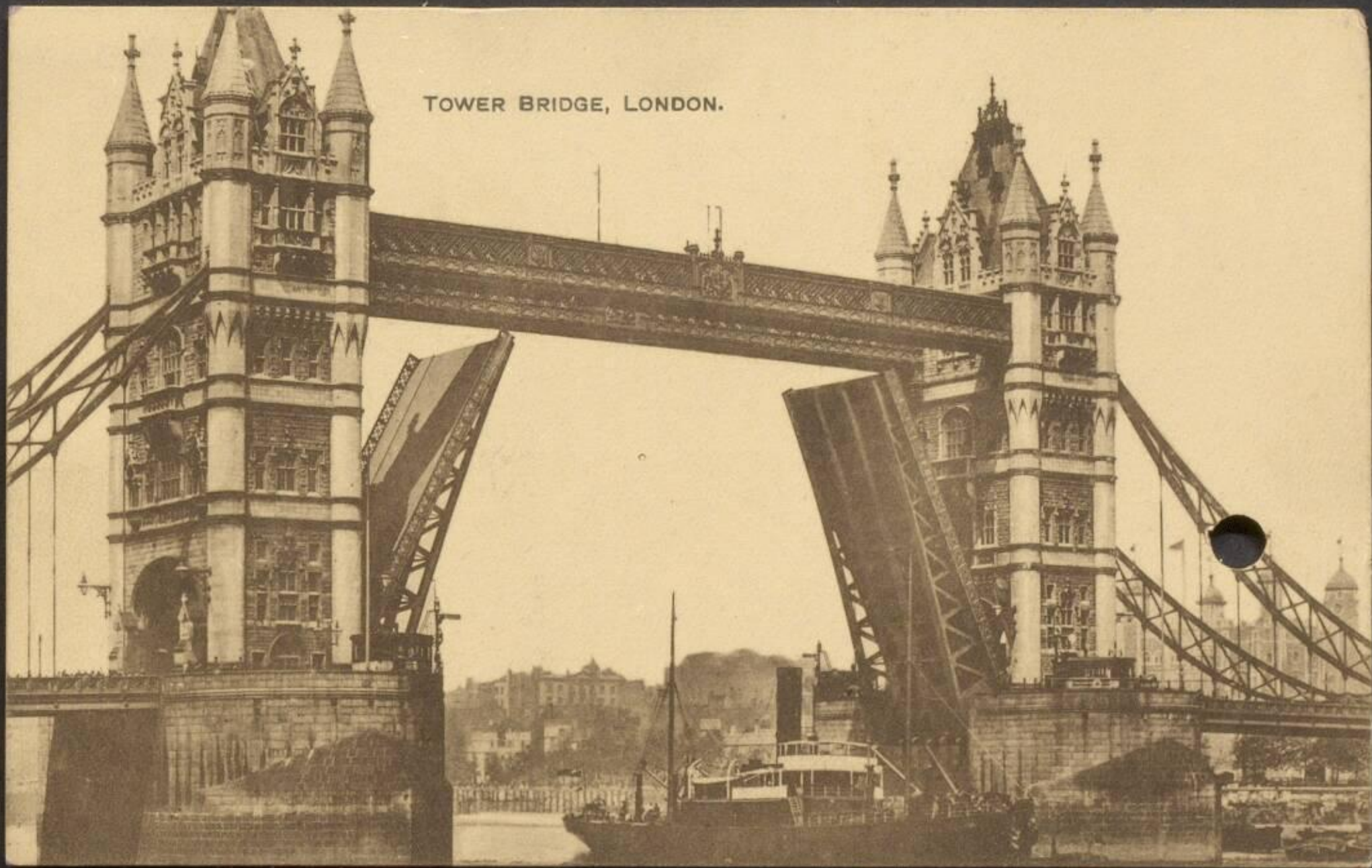
TOWER BRIDGE, LONDON.