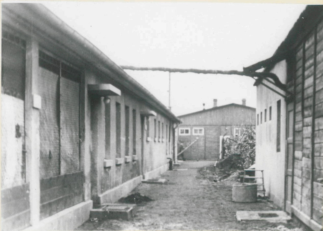
Bad und Entlausung