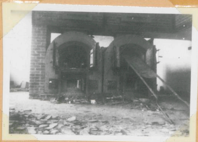
Krematorium Neuengamme 2 Öfen