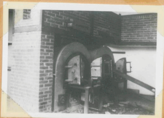
Öfen in den letzten Tagen der Räumung - Krematorium 25. 4. 45