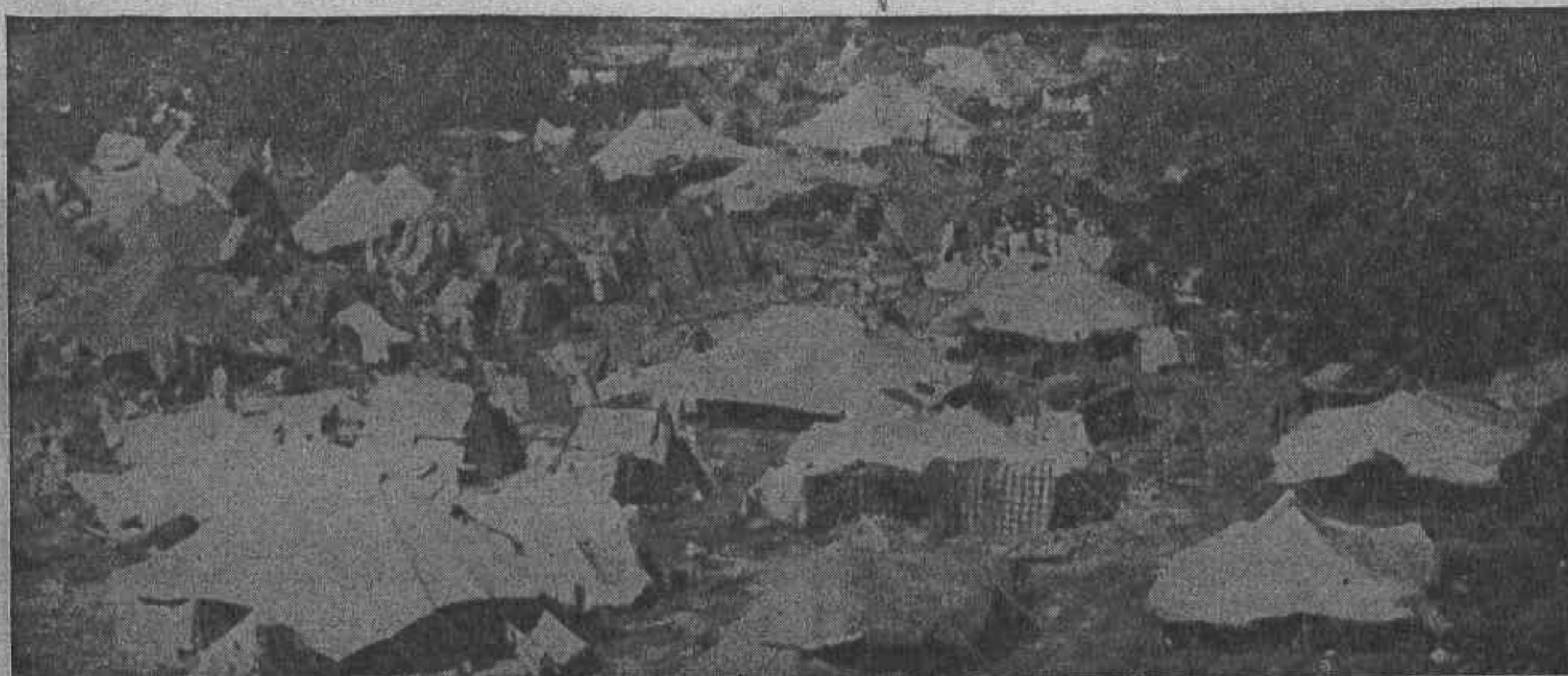
Flüchtlinge aus Pakistan.