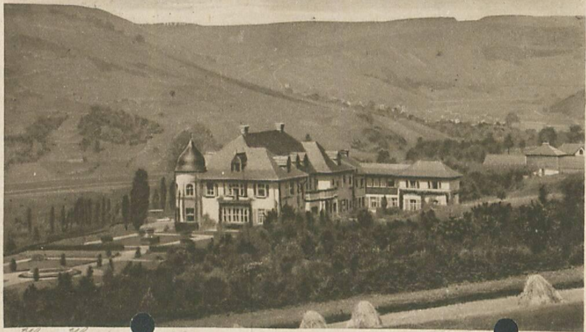
Haus Horst. 27. 8. 36.